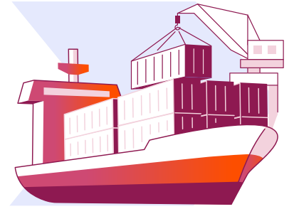
Nihai alıcılar (deniz taşımacılığında)