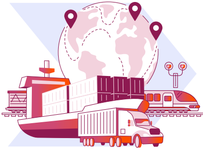
Denizler ve iç sular, kara yolları ve demir yollarında faaliyet gösteren nakliye şirketleri